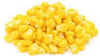
BLAT DE MORO