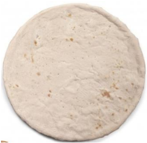
BASE DE PIZZA